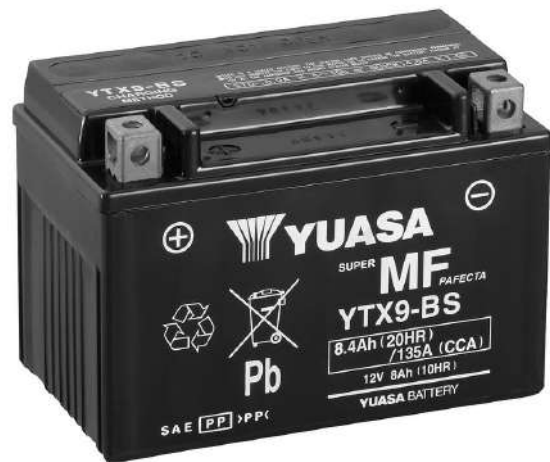
For Illustration Purposes Only