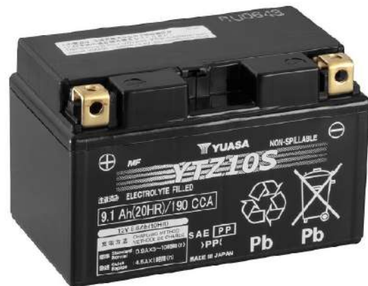
For Illustration Purposes Only