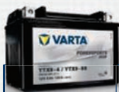
TABELLE DELLE SPECIFICHE